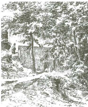
La fontaine à l'origine (d'après un dessin des frères DUTHOIT)

Cette fontaine était située au bas de la montée du château. Elle a été longtemps célèbre par les guérisons d'enfants fiévreux ou retardataires qu'on y plongeait. Un aménagement récent (2000) a permis de rendre à cette source une vie nouvelle, sur l'ancien emplacement, a été construite une fontaine, mais elle ne doit son eau qu'à un forage qui descend jusque dans la nappe.