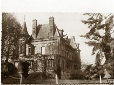
Le château actuel date du XIX e et abrite aujourd'hui un foyer d'aide et de réinsertion pour filles(FAR.)

Dans les vieilles coutumes et traditions, On note à propos du Château : les « Danses au rond point des fées ». Ce lieu se trouvait dans le bois du Château, on y dansait le lundi de la fête du village.