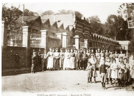
PONT-DE-METZ (Sousmeuse) - Reprise de l'Usine

Sur le site, à l'origine on trouvait avant 1890 l'usine BRALANT qui fabriquait des bougies et des cierges, puis en 1890, M. DESQUIENS fit construire à côté de ceux de son beau père, des bâtiments dans lesquels on teintait les fils et on lustrait et d'autres bâtiments où jusque 200 métiers tissaient le velours. Les portes de l'usine ont fermé en 1936 après les grèves du front populaire